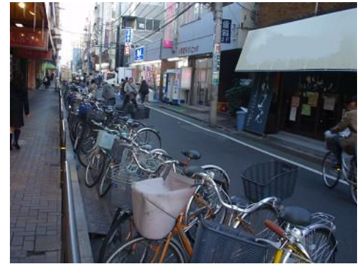
綾瀬駅周辺の違法駐輪・放置自転車

放置自転車が起る原因としては、駐輪場が駅から遠い、短時間で利用できる枠が少ないなどがあるようです。放置自転車解消には、公園なども利用した駐輪場の適切な整備と、一時利用に適していると言われるラック式の駐輪場を設置するなど、古隅田川の整備事業など総合的な計画の中での具体的な対策を求めました。