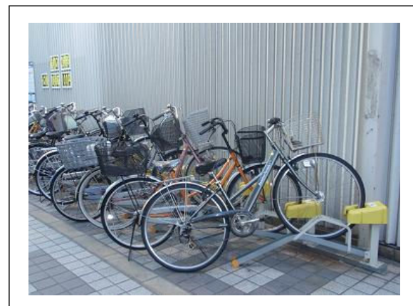
店舗前に有料のラック式駐輪場を設置した例