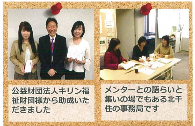
公益財団法人キリン福祉財団様から助成いただきました